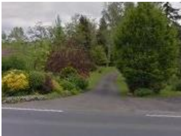
Figure 2 : Vue du chemin en enrobé sur la parcelle CA449 utilisé pour accéder à la parcelle