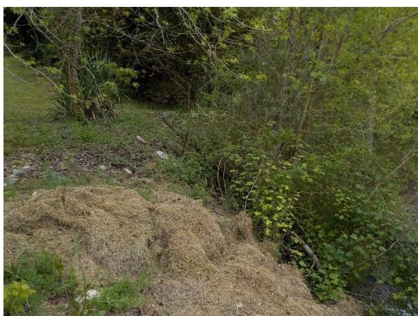
Figure 4 : Vue de la partie en bord d'Ouzom de la parcelle CA462