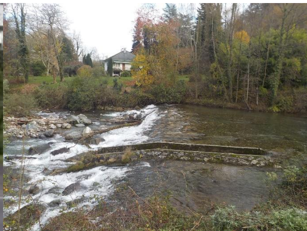
Figure 3 : Vue des parcelles CA462 et CA498 depuis la berge rive gauche