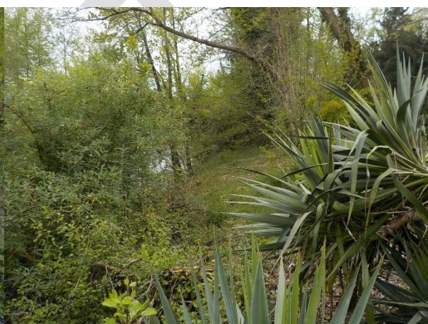
Figure 5 : Vue de la partie en bord d'Ouzom de la parcelle CA462