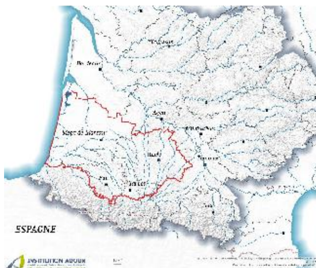
Périmètre aquifères captifs de Gascogne